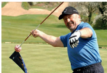
Klaus Wolfermann Olympiasieger Speerwurf KIO e.V. Botschafter