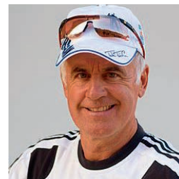
Fritz Fischer Olympiasieger Biathlon KIO e.V. Botschafter